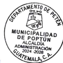
JOSÉ OBDULIO PINTO VIDES ALCALDE MUNICIPAL POPTÚN, PETÉN