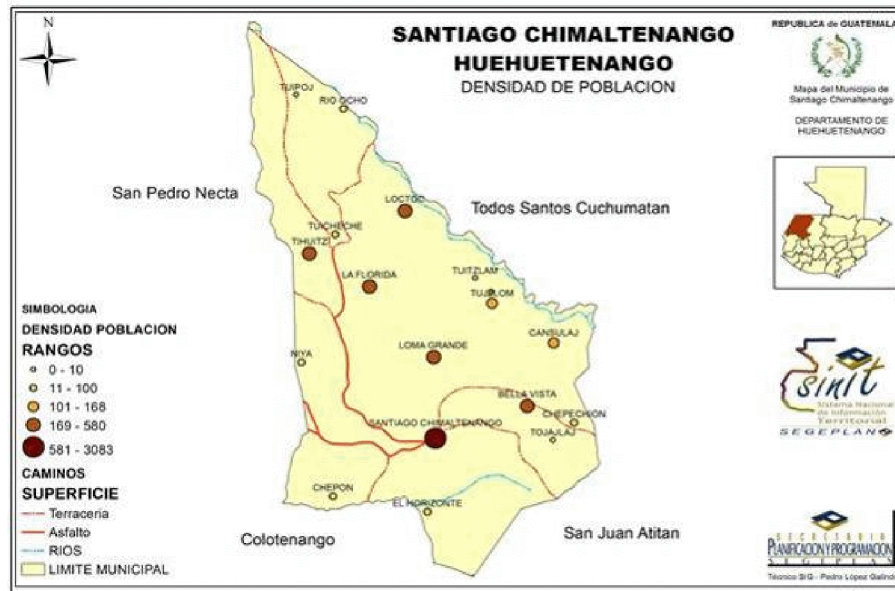
Figura No. 1 Lugares poblados con mayor población del municipio, Santiago Chimaltenango. INE 2002

El INE estima una densidad poblacional de 178.17 hab/km 2 , mientras que crecimiento poblacional, según el promedio de densidad poblacional nacional debiera ser de 103 hab/km 2 , lo cual indica que el municipio ya sobrepasa el promedio poblacional por kilómetro cuadrado, por lo que es una variable que es necesario frenar para no seguir sobre poblando al territorio de Santiago Chimaltenango.