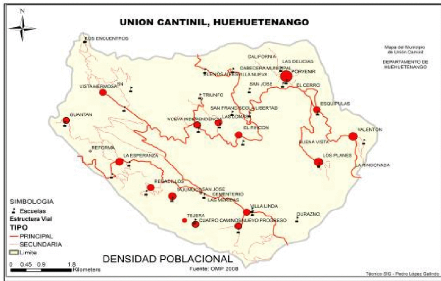
Figura No. 2 Concentración de la población. DMP y SEGEPLAN 2010

De acuerdo al análisis de conectividad se estableció que los centros poblados con mayor eficiencia de conectividad con el resto de comunidades, o sea mayor facilidad de comunicación, son en su orden: San José, La Esperanza, Vista Hermosa, Nueva Independencia y Tajumuco. Ver figura No. 3.