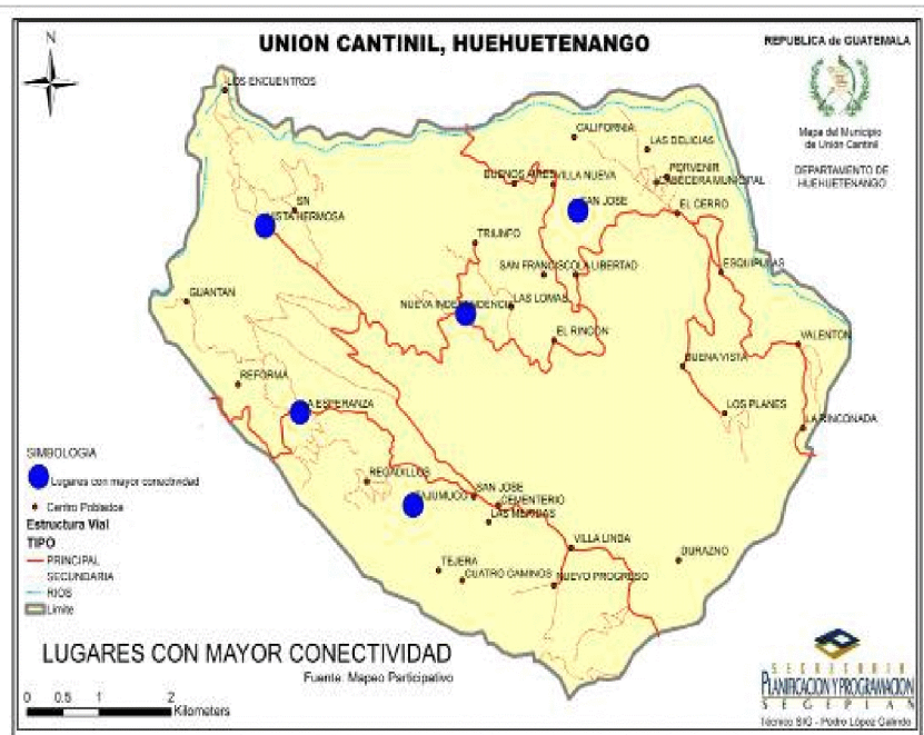
Figura No. 3 Comunidades con mayor eficiencia de conectividad. DMP y SEGEPLAN. 2010

De acuerdo al análisis de conectividad se estableció que los centros poblados con mayor eficiencia de conectividad con el resto de comunidades, o sea mayor facilidad de comunicación, son en su orden: San José, La Esperanza, Vista Hermosa, Nueva Independencia y Tajumuco. Ver figura No. 3.